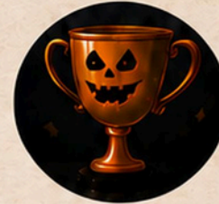
Kürung des Monsters des Abends