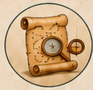
Schatzsuche durch die Altstadt von Lübeck mit kniffligen Aufgaben